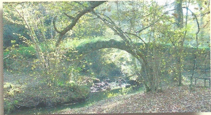
Le pont romain

On raconte qu'un jeu de quilles en or y est caché. Vous pourrez vous reposer au bord du ruisseau de l'Andan sur lequel a été construit un pont romain emprunté par une voie romaine.